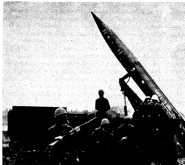
Una fase delle esercitazioni Nato svoltesi in Friuli lo scorso ottobre

Questa posizione è assurda perché presuppone che a determinare i contrasti e quindi ad avvicinare la guerra sarebbero gli armamenti e l'"opinione" che un blocco si fa dell'altro, e non viceversa. Inoltre, emerge l'immagine di un imperialismo tedesco privo di artigli e succube dei reci-