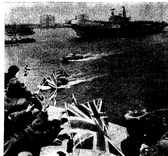
Il risveglio del nazionalismo alla partenza della "Task Force" Britannica per le Falkland-Malvine

Fatti recenti forniscono una clamorosa conferma. Ci domandiamo infatti: che fine ha fatto quel movimento pacifista che nell'ottobre del 1981 ha inondato le piazze di Londra? Quali iniziative concrete ha assunto in questo arco di tempo per preparare le masse ad una opposizione ai preparativi di guerra del governo Thatcher? Dov'era quando la flotta britannica ha preso il largo verso le Falkland? Le cannonate della Task Force nell'Atlantico meridionale, coronate da una eclatante vittoria elettorale del governo conservatore alle recenti elezioni amministrative, sono la risposta a questo interrogativo.