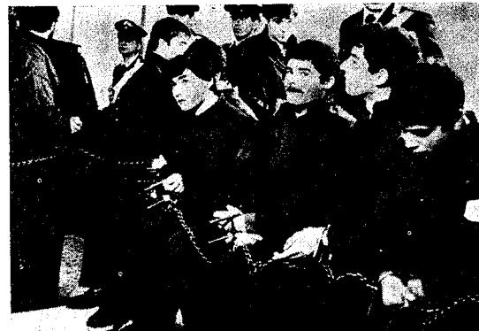
I militari della caserma di S. Maria Capua Vetere, in catene al processo

stato protagonista il corpo di guardia della caserma di Capua, mandato in blocco sotto processo a seguito del colpo di mano BR, è significativo al riguardo: per 40 anni i corpi di guardia hanno sonnecchiato, e ufficiali di alto e di basso rango hanno chiuso un occhio, se non tutti e due. Oggi, si vuole così ammonire le giovani reclute che